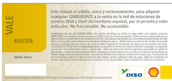
Imagen genérica válida sólo a efectos ilustrativos – cheque sin valor.